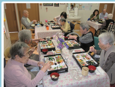
敬老会での御家族との交流