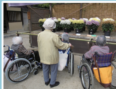
後楽園にて菊鑑賞（年2回の1日旅行）