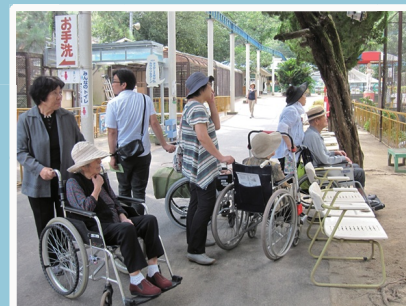
池田動物園遠足での1コマ