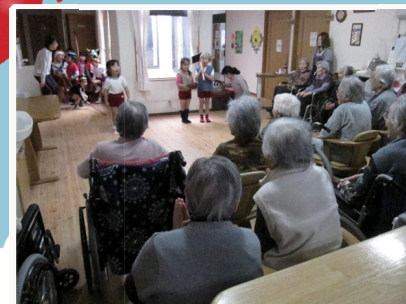
近くの保育園児達の慰問風景